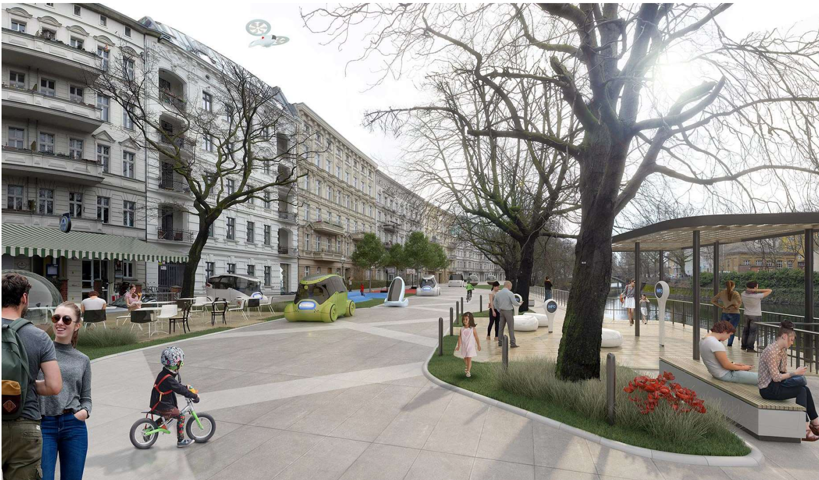
© xoio GmbH & ium-Institut für Urbane Mobilität