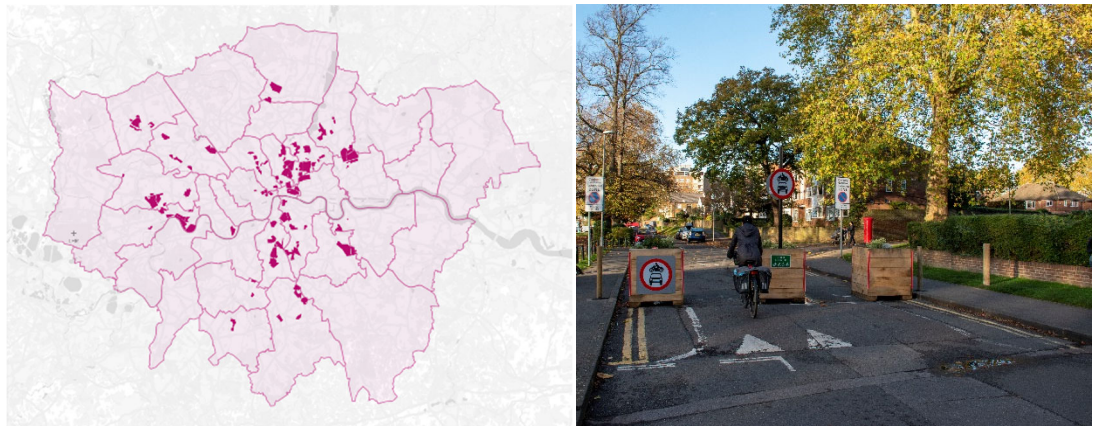
Abb. 2: Low Traffic Neighbourhoods in Londoner Bezirken, umgesetzt zwischen März 2020 und März 2022

Quelle: Aldred & Thomas, 2023 (links); rechts: modaler Filter im LTN Kingston upon Thames; Bild: Jack Fifield via Flickr