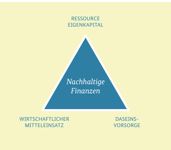
Abbildung 2: Das Dreieck nachhaltiger Kommunalfinzen

Das kann ihr nur gelingen, wenn sie die Ressourcen effizient und effektiv einsetzen. Effizienz heißt „die Dinge richtig tun“: langfristig planen, Transparenz herstellen, im Sinne der erwünschten Ziele steuern und vieles andere mehr. Dazu hat das Difu schon 2011 im Auftrag des Nachhaltigkeitsrates und auf Veranlassung der am Dialog „Nachhaltige Stadt“ beteiligten Oberbürgermeisterinnen und Oberbürgermeister Vorschläge erarbeitet.