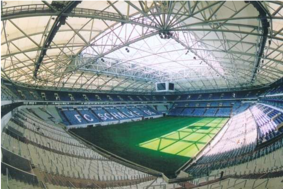
Abb. 3: Die Arena 'Auf Schalke', jetzt nach einem Sponsor 'Veltins Arena', die 2001 eingeweiht wurde und 61.524 Zuschauer fasst.

'Bausteinen', die im Lauf von zehn Jahren als Gutscheine zum Einkauf im Fanshop zurückgezahlt werden, finanzieren auch die Fans das Projekt des FC Schalke 04 mit. Das Finanzierungskonzept der Arena sieht vor, die entstandenen Kosten in einem Zeitraum von 15 Jahren zu begleichen. 22