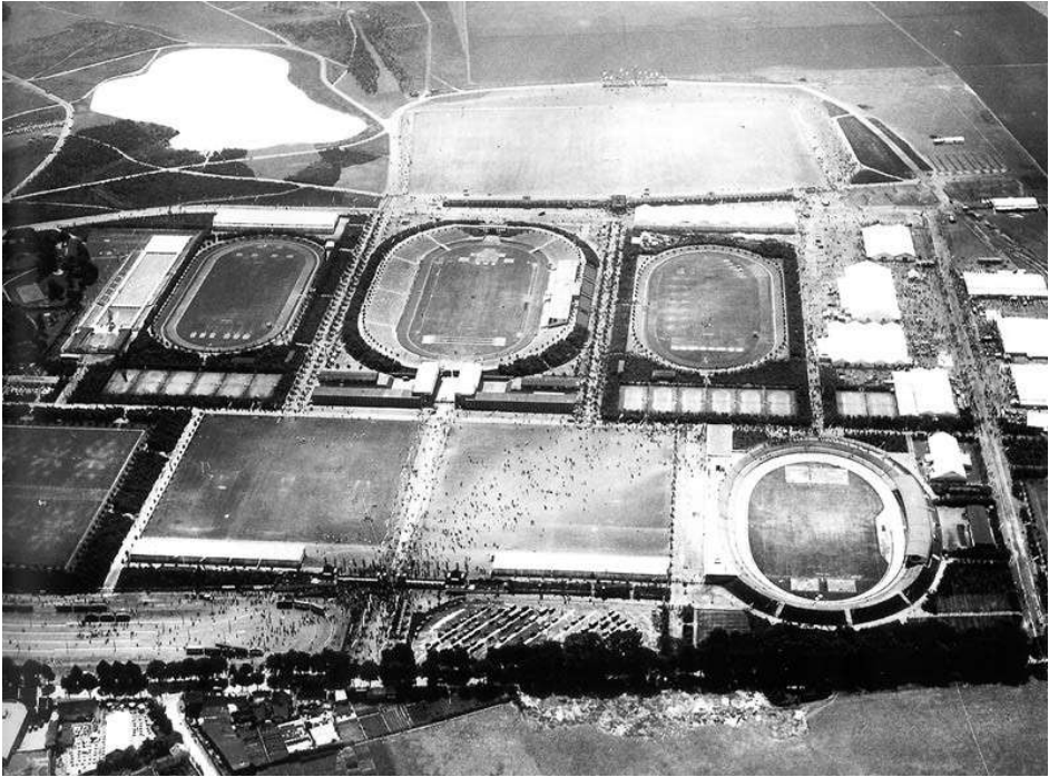
Abb. 1: Das Müngersdorfer Stadion wurde auf Betreiben von Konrad Adenauer errichtet und 1923 eröffnet. Mit 80.000 Zuschauer war es das größte deutsche Stadion, umgeben von einer Radrennbahn, einem Freibad, einem Reitstadion, mehreren Fußballplätzen und einem Trainingsgelände für Leichtathleten.

Eine Durchbrechung der Norm stellen möglicherweise auch die – vordergründig – ‚inadäquaten‘ Nutzungen von Stadien dar, die meist für eine sportliche Verwendung konzipiert und gebaut wurden, auch wenn oft die Abhaltung anderweitiger Veranstaltungen bereits mit berücksichtigt war. Doch die spezifische Architektur der abgeschlossenen, für die Disziplinierung des Blickes von ‚Massen‘ entworfenen und nach Klassen- und Geschlechtermustern segregierten Stadien erwies bald ihre Tauglichkeit für unterschiedliche Anlässe. Von Dollfuß’ Trabrennpplatzrede bis zu Hitlers und Goebbels’ Sportpalastreden wurden Stadien und Sportarenen für politische Manifestationen genutzt. Ebenso dienten sie als Kasernen und als Lager, als Gefängnisse und Orte religiöser Versammlungen. Sie ließen sich für Opernaufführungen, Zirkusvorführungen und Rock-Konzerte ebenso verwenden wie als Campingplätze oder – in den Kriegsjahren – als Gemüsegärten.