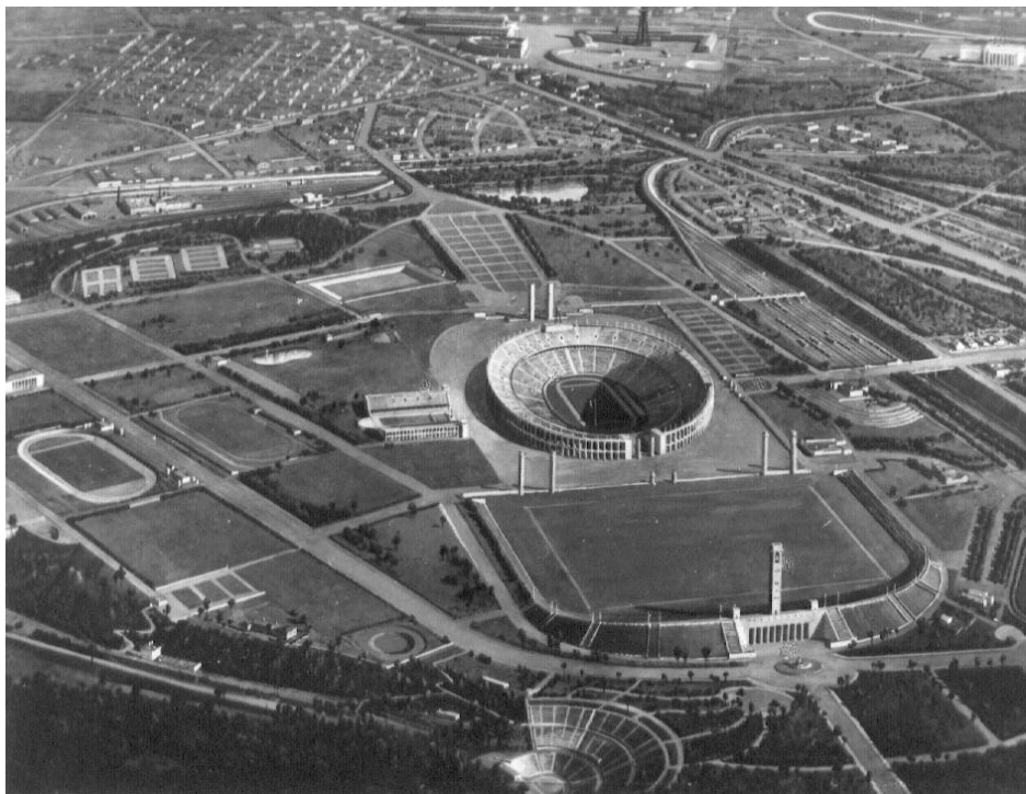
Abb. 3: Von Adolf Hitler eigenhändig neu konzipiert: Das Olympiastadion in Berlin inmitten des Reichsportfeldes, Ansichtskarte von 1936.

Spielen 1936 in Berlin geplant wurde, oder auch die NS-Kampfspiele oder SA- und HJ-Reichswettkämpfe: 16 Sie alle bedurften zur intendierten nationalen wie internationalen Machtdemonstration mächtiger zentraler Stadionbauten, in denen sich schon architektonisch die jeweilige Ideologie finden sollte.