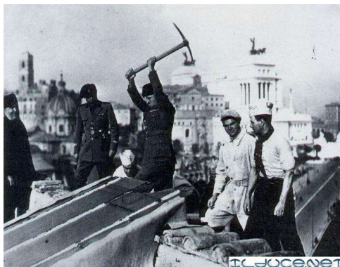
Abb. 2: Mussolini als Bauherr des Foro Mussolini in Rom Anfang der 1930er Jahre, heute Foro Italico, wo sich u.a. das Olympiastadion befindet.

Aber noch mehr waren es kommunistische wie faschistische Nationen, die sich in zentralen Stadionanlagen Monumente zum Vorweis ihrer Bedeutung errichten: Sowohl die Moskauer Stadion-Bauten der 1920er Jahre, als auch das 1932 eingeweihte Foro Mussolini (später Foro Italico) in Rom oder das schon vor der Machtübernahme der Nationalsozialisten begonnene, später nach Hitlers Plänen umgestaltete Olympiastadion in Berlin entsprachen deutlicher dem Typ des Sportparks mit unterschiedlichen Sportanlagen und Nutzungsmöglichkeiten. 13 Gemeinsam war diesen Stadien, dass sie den Massen in zweifacher Hinsicht offen stehen sollten: als Zuschauerinnen und Zuschauer auf den Tribünen wie als Akteure auf dem Rasen. Darüber hinaus waren diese Stadien auch in besonderer Weise für außersportliche Verwendungen gedacht.