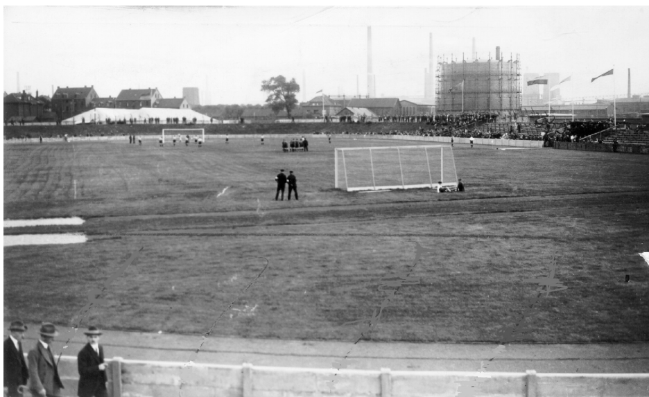
Abb. 2: Platzeinweihung der Kampfbahn Glückauf, umgeben von Industrie, am 25.8.1928.

standen sechs Umkleideräume, ein Raum für den Schiedsrichter, sanitäre Anlagen und ein Hauptportal in den Vereinsfarben blau und weiß. Eine Mitgliederversammlung einigte sich im Juni 1928 darauf, das bis dahin namenlose Stadion 'Kampfbahn Glückauf' zu nennen, drückte mit dem Bergmannsgruß die Verbundenheit zur lokalen Industrie aus und entsprach mit der Verwendung des Begriffes 'Kampfbahn' statt der griechischen Bezeichnung 'Stadion' auch dem verbreiteten deutsch-tümelnden Zeitgeist. 5