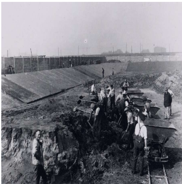
Abb. 1: Bauarbeiten an der Kampfbahn Glückauf, 1928.

Da die Städte des Ruhrgebiets in diesen Jahren die bis dahin unvollständige Urbanisierung nachholen und ihre Entwicklungsdefizite ausgleichen wollten, versuchte auch die Stadt Gelsenkirchen durch eigene und die Förderung fremder Aktivitäten die städtische Ausstattung zu verbessern.