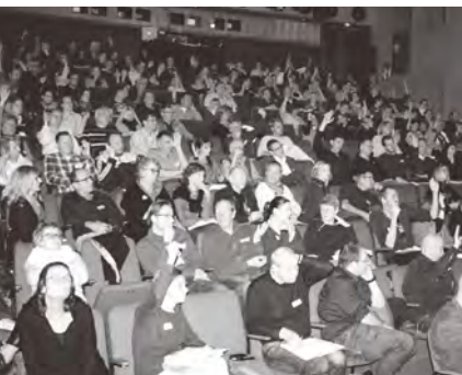
Blick in den Veranstaltungssaal