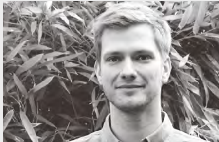
Roman Soike